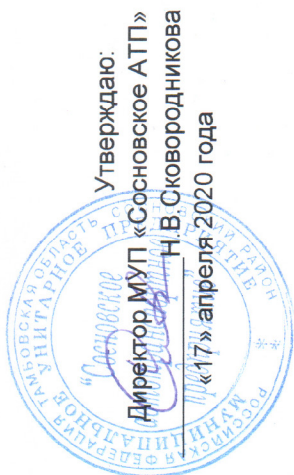
ТАБЛИЦА стоимости проезда по маршруту р.п.Сосновка-с.Л.Горы-Тамбов